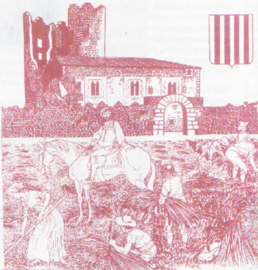
Portada del programa de la Festa Major 1980 (Arxiu Taller d'Història)

Us informàvem en l'editorial del darrer Butlletí que estàvem preparant una sèrie d'activitats per celebrar que l'any vinent seria el mil·lenari de la primera referència escrita sobre Maçanet.